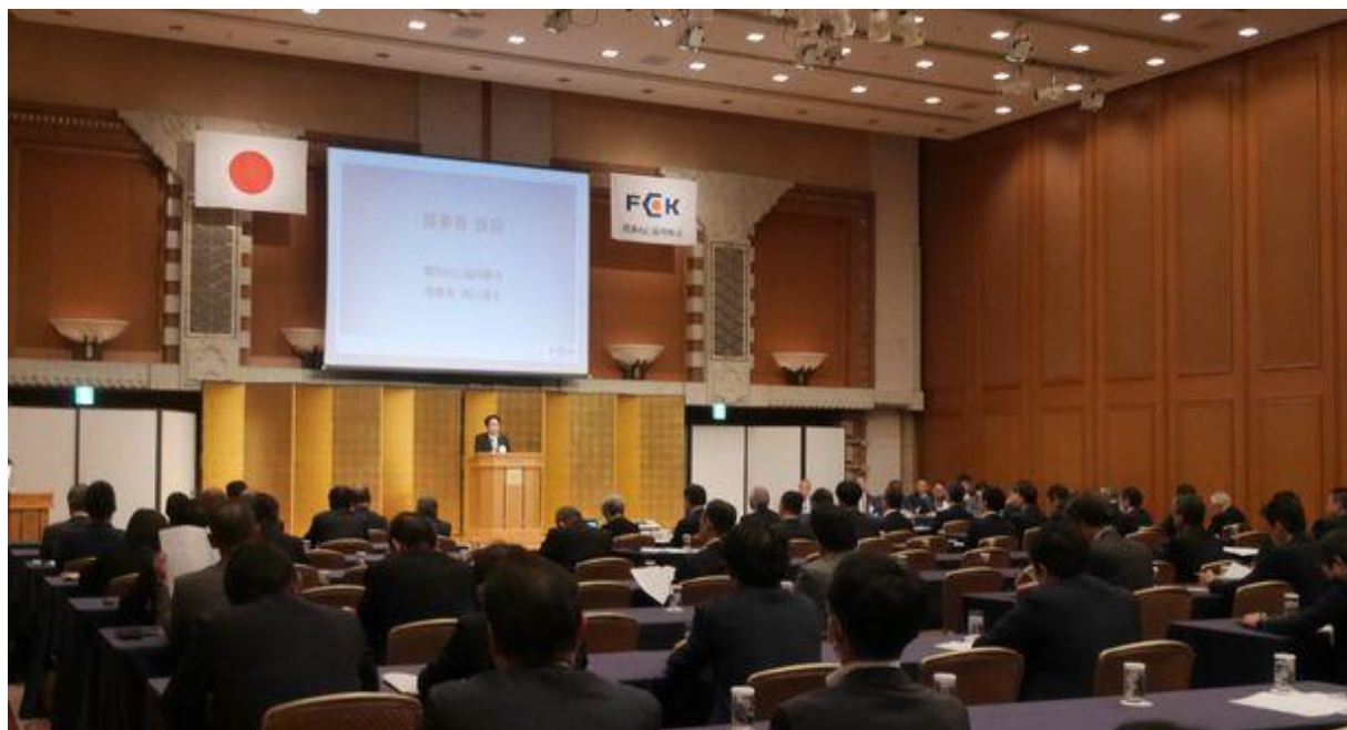
第21回通常総会会場

〒537-0025 大阪市東成区中道 3-15-16 毎日東ビル TEL06-6974-0531 FAX06-6975-2181 email info@kansaineji.com URL http://www.kansaineji.com