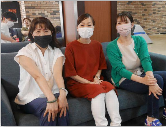
三人で力合わせて、優勝目指すぞ!!