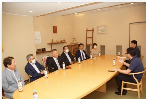
インタビュー風景

奥山社長とお話をしていると話題が尽きず、気が付けば90分を過ぎておりました。長時間の取材にお付き合いして頂き、心より御礼申し上げます。