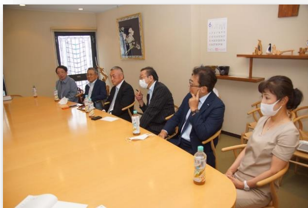
広報委員会メンバー

当社は現在取り扱いアイテム（登録）数が188万点、そのうち13万点でバラ対応を行っています。在庫数の拡大が肝要となりますので、限られたスペースの有効活用に東大阪物流センターでは立体自動倉庫を使い高さ方向に対して容積を確保しています。最近では、東大阪物流センターに小箱用倉庫の5号館を建設し、(株)オカムラ様製で高さが国内最大級であるロータリーラックを設置しました。国内最大級の高さになったのは高さ方向に保管スペースを作るしか方法がないというのが理由です。