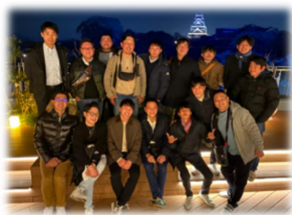
研修旅行会の様子