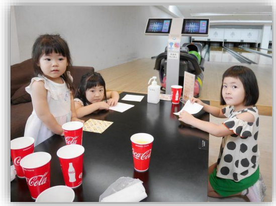
ボウリングでたくさん思い出作ろう

大会はボウリング場のアナウンスでスタートし、約1時間に渡って、団体戦は1チーム3名、1人2ゲーム、チーム6ゲームのトータルピン数で、また、個人戦は1人2ゲームのトータルピン数で競いました。(ハンディキャップは、1ゲームにつき、女性・小学生以下+20点、小学生以下の女子30点、昨年男子個人戦上位者には1位-25点~5位-5点)