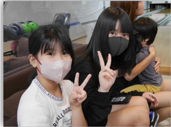
カメラさん、可愛く撮ってね