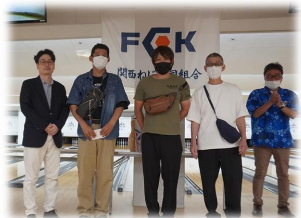
団体戦第3位：㈱エコーA