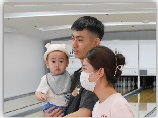
しっかり応援するね!!みんな頑張れ!!