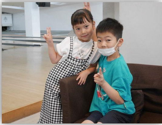
今からボウリング! がんばるぞ!