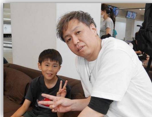
ボウリングに来て良かった!