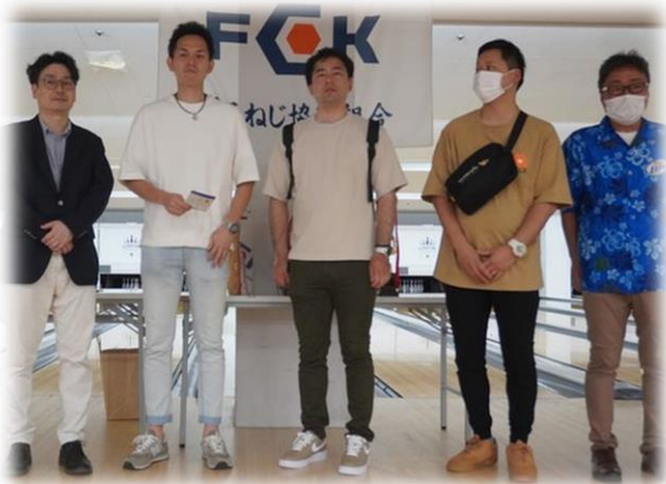
団体戦準優勝：マコト産業㈱A