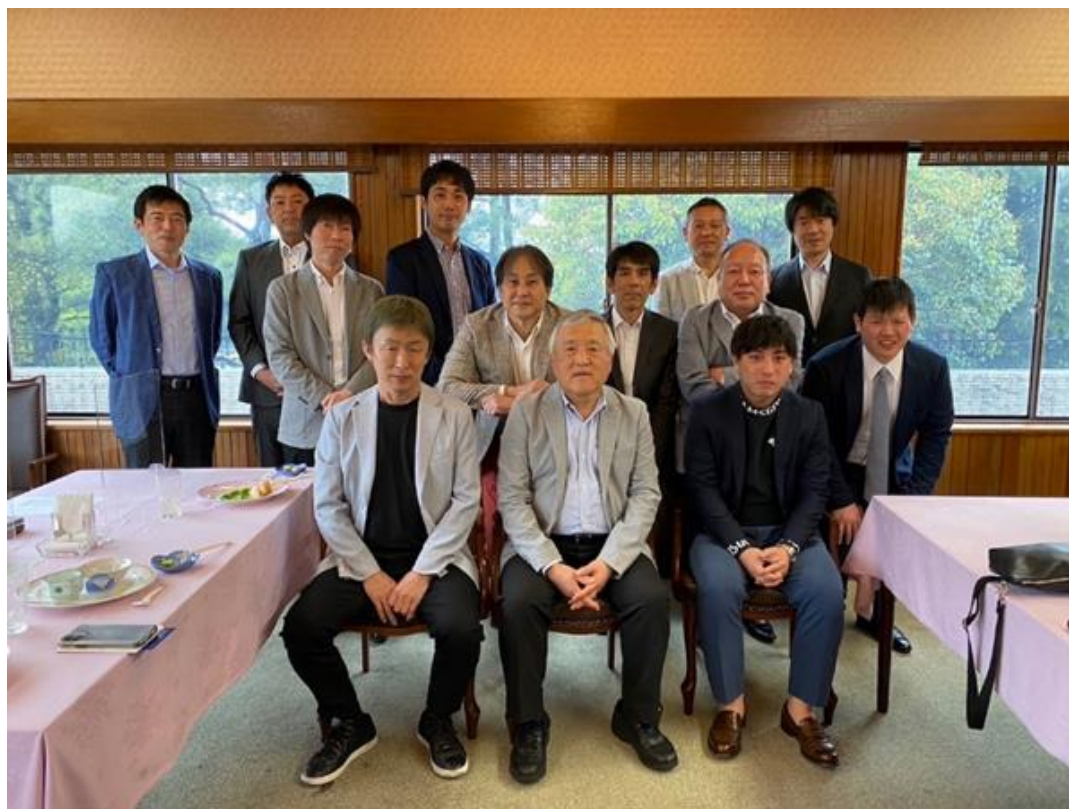
2023.4.12 ゴルフ懇親会 枚方カントリー倶楽部にて